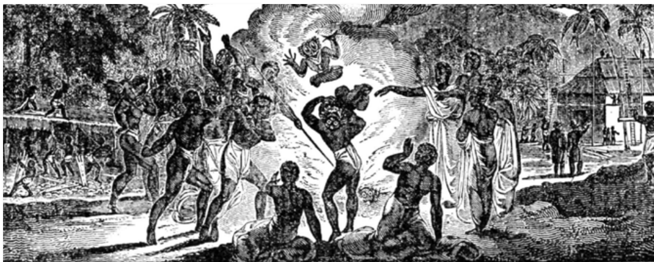
Destruction des idoles.