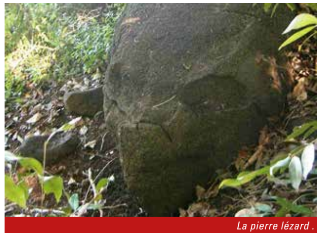
La pierre lézard .