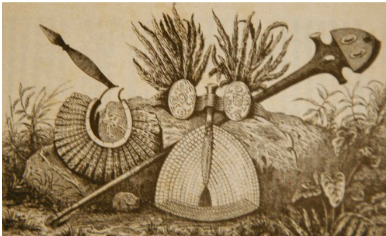
Armes et parures de chefs.

B erceau des grands roi et chefs de Tahiti, jusqu'à l'arrivée des Européens, le statut des ARI'I de Punaauia resta d'un prestige et d'un rang supérieur à toutes les autres familles princières de l'île de Tahiti. Le grand Roi de Tahiti, Tetuana'e Hitinui ou Tetuana'e Nui, ceint des deux grandes ceintures royales de plumes rouges (Maro 'Ura) et jaunes (Maro Re'a) est à l'origine de l'établissement de la grande dynastie royale et puissante de Punaauia.