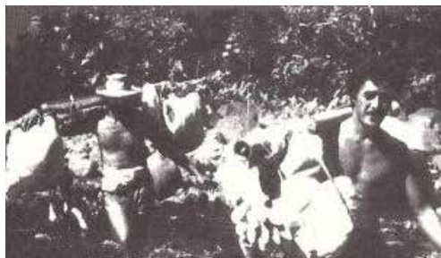
Porteurs d'oranges de retour du plateau TAMANU (4)