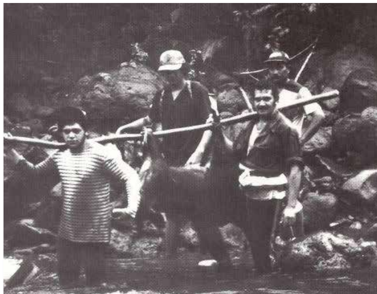
À Punaauia, porteurs d'oranges et chasseurs de cochons sauvages se sont constitués en associations pour perpétuer cette tradition, mais aussi pour veiller à la protection du plateau des orangers.