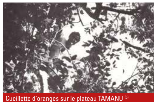
Cueillette d'oranges sur le plateau TAMANU (5)